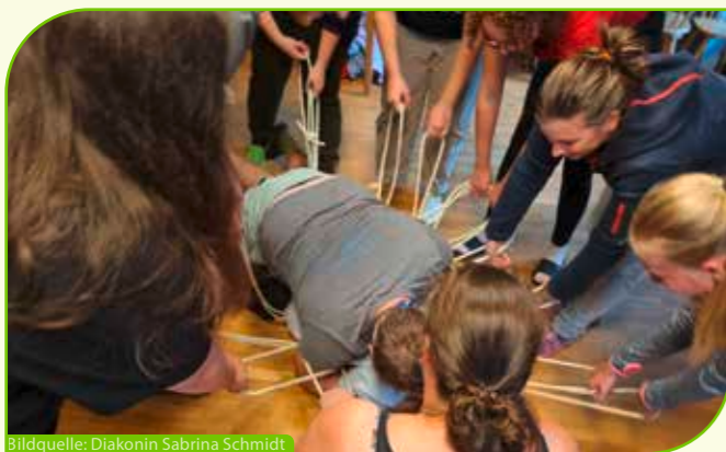
Bildquelle: Diakonin Sabrina Schmidt